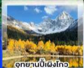
อุทยานปี่เฉิงโกว