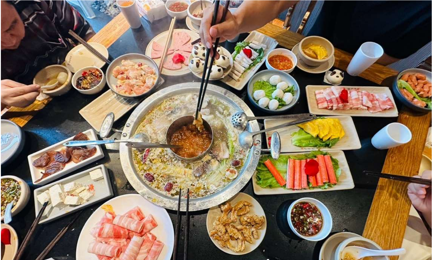
กลางวัน รับประทานอาหารกลางวัน ณ ภัตตาคาร (เมื่อที่ 17) *เมนูพิเศษสุกี้หม่าล่าเสฉวน