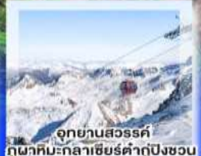
อุทยานสวรรค์ ภูผาหิมะกลาเซียร์ตำกู่ปิงชวน