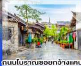
ถนนโบราณชอยกวางแคบ