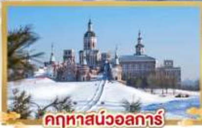
คฤหาสน์วอลการ์