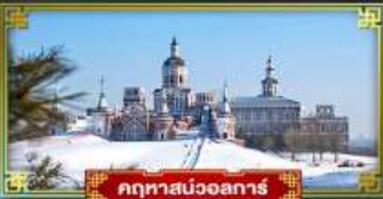
กททาส่นวอการ์

อลังการงานแกะสลักน้ำแข็งระดับโลก Harbin Ice Festival