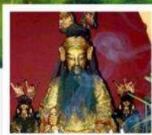
เอียงบู๊ซิว