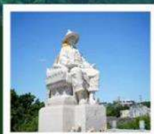
สุสานพระเจ้าตากสิน