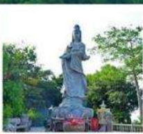
เจ้าแม่ทับทิม