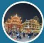
พาซื้อป๊ิง เมืองเก่าชิวเถา