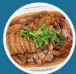
เมนูพิเศษ คัมภีร์ห่านพะโล้