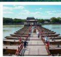
สะพานวัวคู่