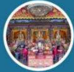
ซอพร วัดแปะฮวยเจียม