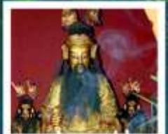
เอียงบู๊ชิว